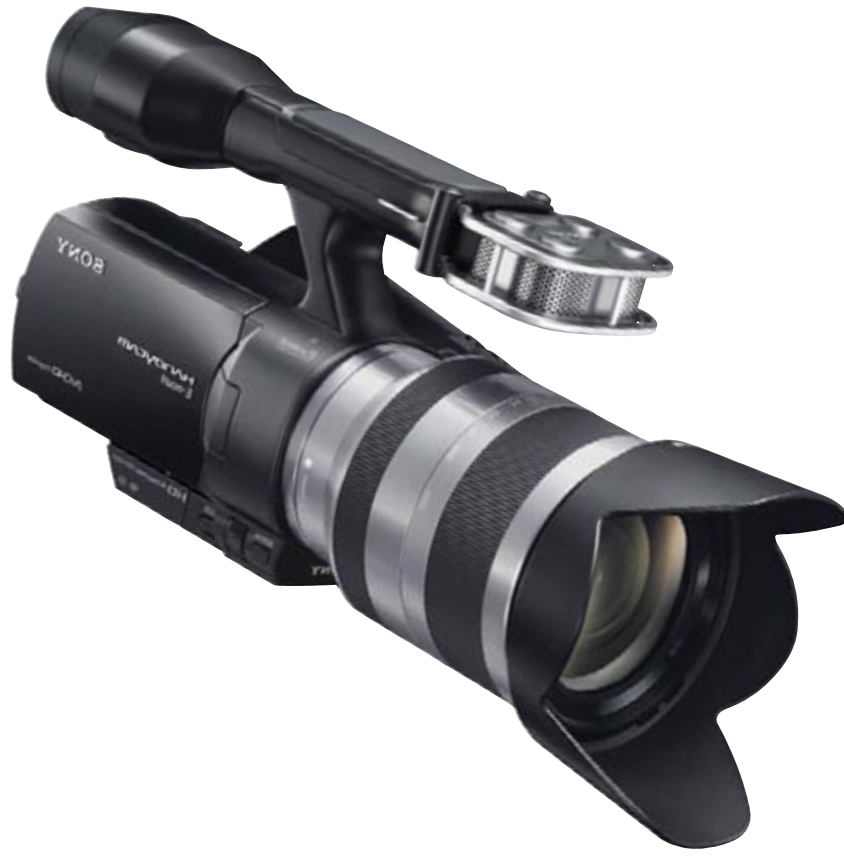
[ Cámara Sony ]