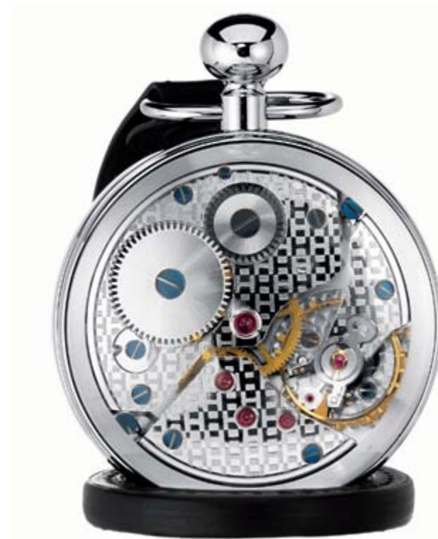
[ Reloj Hermès Pendulette Boule ]